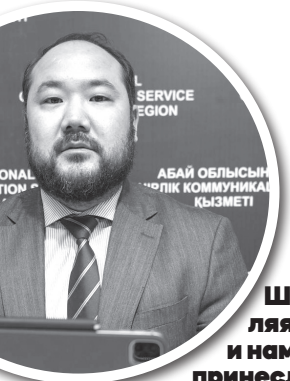
АБАЙ ОБЛЫСЫНЫҢ «ӘЛІК КОММУНИКАЦИЯ» ҚЫЗМЕТІ

Для популяризации туризма в области был даже разработан интерактивный путеводитель по основным достопримечательностям и значимым местам, включающий в себя 80 объектов архитектуры, историко-культурного наследия, торгово-развлекательных